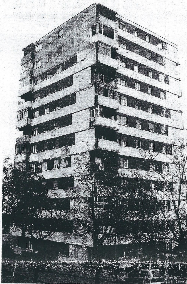
Neuspješni pokušaji predstavnika stanara i vlasnika stanova da od Brunate dobiju objašnjenje te da se ovrhe povuku - zgrada u Ulici Nike Katunara 13