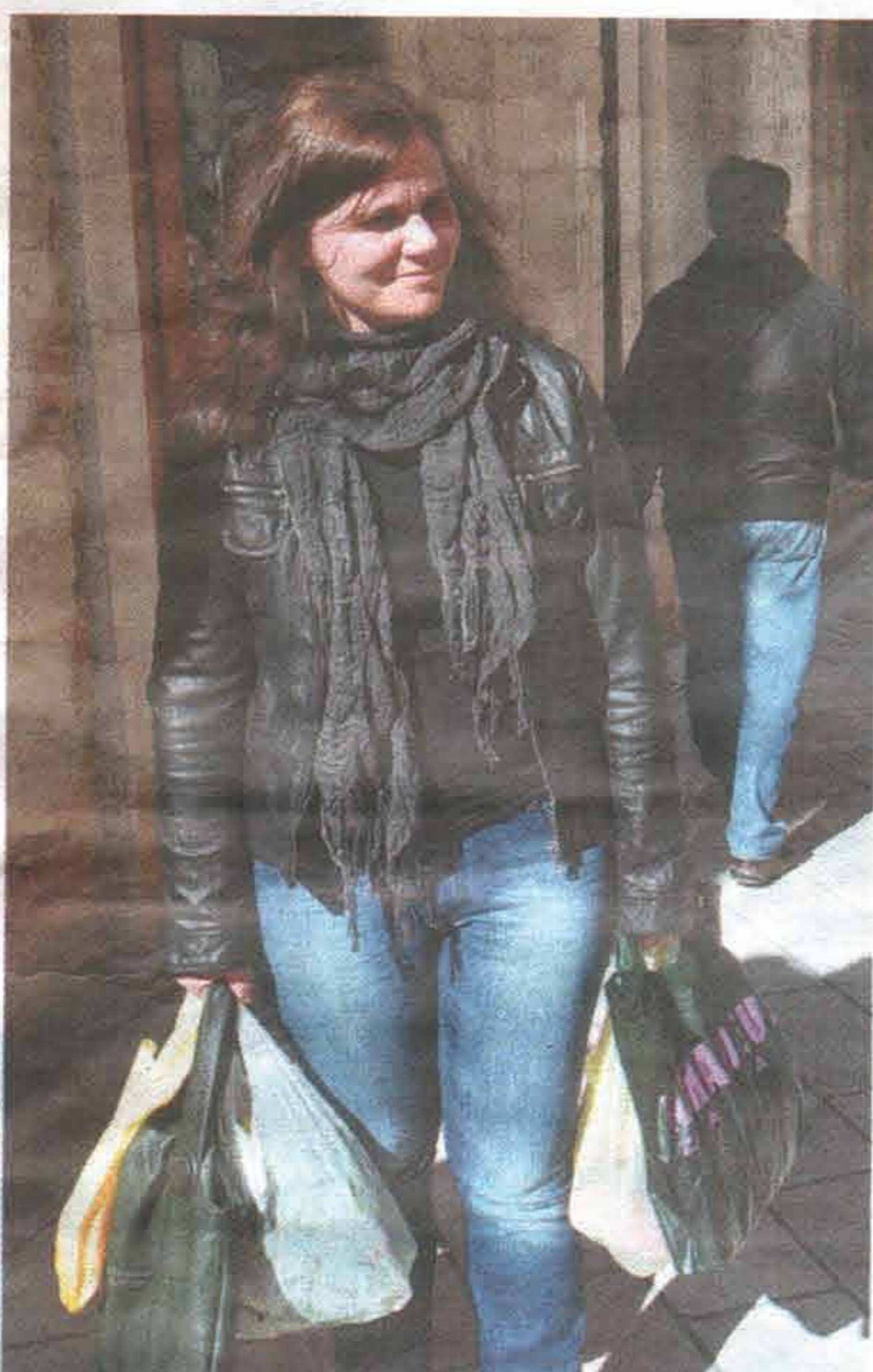
Mnogi su se kupci imali priliku uvjeriti u varanje i potkradanje

- Kod javnih usluga, kao što su električna energija, prirodni plin, toplinska energija, ne postoji savjetodavno tijelo koje djeluje u skladu sa Zakonom o zaštiti potrošača. Rezultat toga je da se propisi i odluke o promjeni cijena navedenih javnih usluga, donose bez sudjelovanja potrošačkih udruga, a što je po Zakonu o zaštiti potrošača prekršaj koji se može kazniti novčanom kaznom, ističu u udruzi Za-