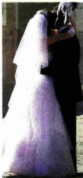
Mladenci i uzvanici još dugo će svadbu pamtit po neugodnoj intervenciji poreznika