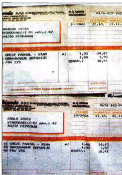
Računi koji su poslani na istu adresu