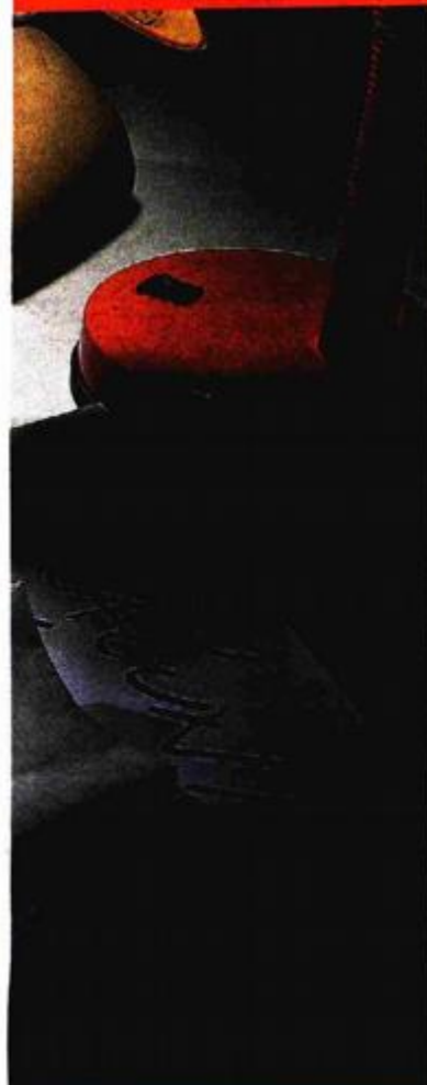
VJEKOSLAV SKLEDAR / CROPIX