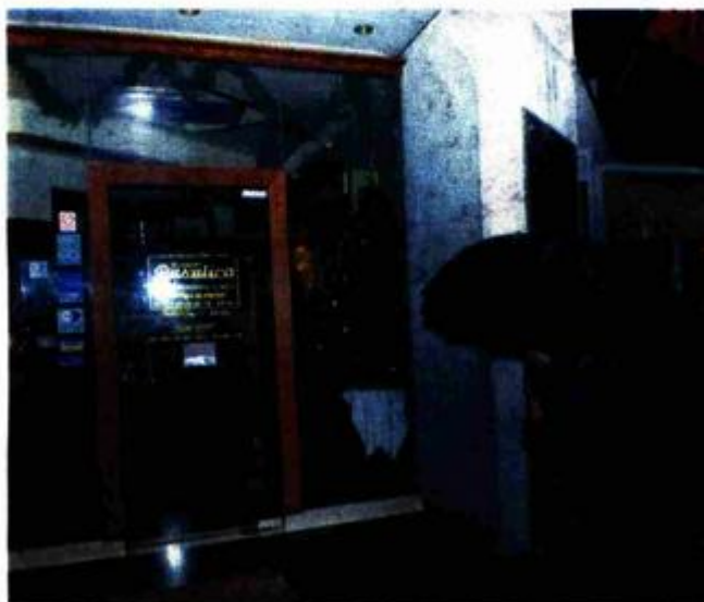
Spomenuta prezentacija održala se u restoranu 'Rusulica' na Trsteniku

•• Ako bračni par s kojim smo išli na prezentaciju i otputuje u Španjolsku, pitanje je koliko će ovaj aranžman za njih biti povoljan. Već smo spomenuli da bi trebali nadoplatiti 499 eura ako žele ići oboje. Dok bi se, međutim, oni za tu cijenu dva dana do Španjolske trebali truckati autobusom, preko jedne etablirane turističke agencije kao što je 'Generalturist', avionom do Barcelone mogu doći za samo 50 eura nadoplate po osobi. Kad se uzme u obzir i da 'Generalturist' ima ovakve aranžmane (Španjolska, vožnja autobusom, boravak u hotelu s tri zvjezdice...), i to po cijeni od 1500 do 1800 kuna po osobi, odnosno 500 eura za dvoje, ispada da naš bračni par ništa nije ni dobio!