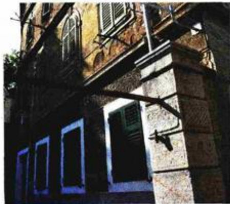
Zgrada sa stanom u centru Rijeke na koji je »sjela« kreditna tvrtka Stratosfera

U novom odgovoru doznajemo da je Zakonom o kreditnim institucijama nadzor povjeren Hrvatskoj narodnoj banci i ako postoje sumnje u zakonitost poslovanja tih ureda – spor rješava HNB i Državno odvjetništvo. Što se tiče potrošačkog kreditiranja, nadležnost kontrole je u rukama Državnog inspektorata i HNB-a, u čemu sudjeluje i Porezna uprava.