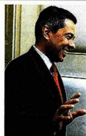
Vladimir Drobniak glavni hrvatski pregovarač s EU-om: U poglavljima o sigurnosti hrane i zaštite potrošača Hrvatska je ispunila sve standarde za članstvo u EU.