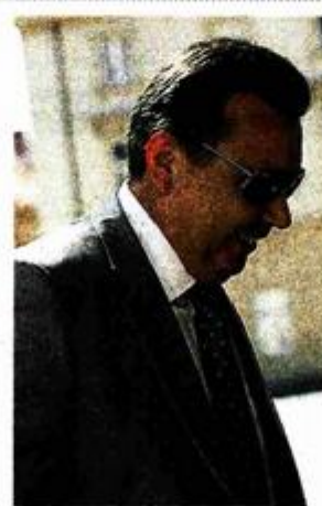
Božidar Pankreć potpredsjednik Vlade i ministar regionalnog razvoja: Netko namjerno želi poljuljati povjerenje u sustav. To se, na žalost, radi namjerno, a sve ove medijske priče su neistinite.