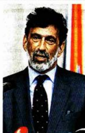
Radovan Fuchs ministar znanosti: Pozivam sve novinare da dođu u Hrvatski veterinarski institut, koji je jedan od najboljih u Europi.